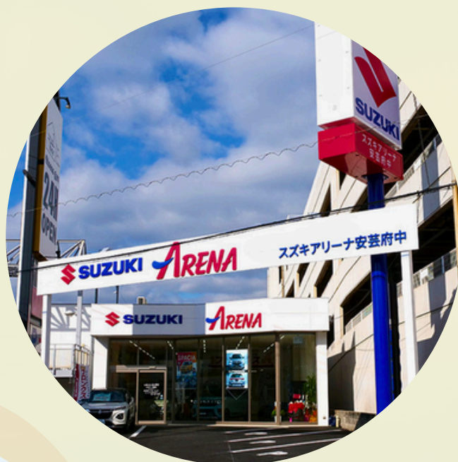
スズキアリーナ安芸府中