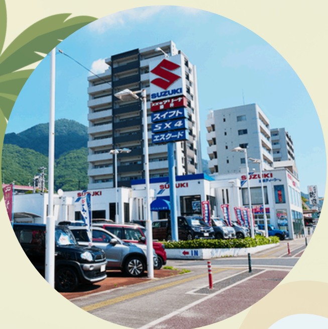
スズキアリーナ緑井